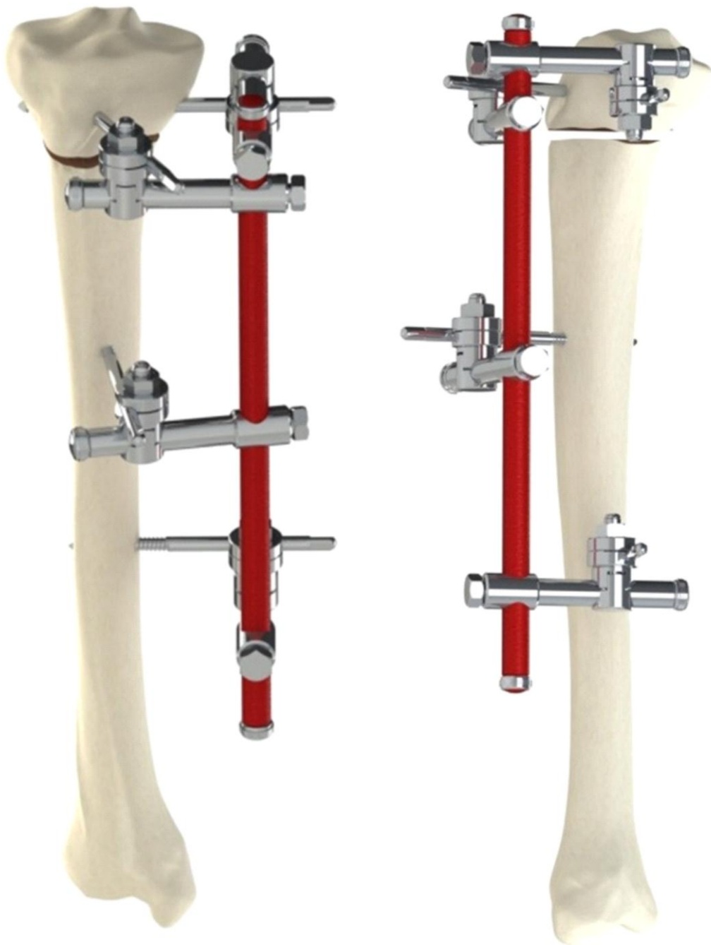
Sl. 16 Pogled sa prednje i bočne strane rama sa sl. 15, pokazuje konfiguraciju klinova za spoljnu fiksaciju proksimalnog epifiznog preloma