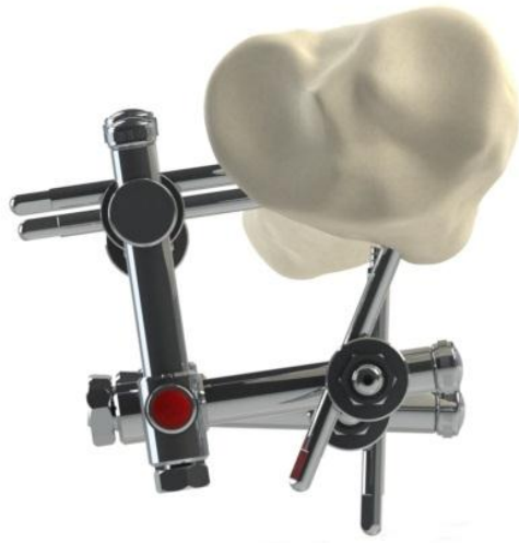
Sl. 17 Pogled odozgo na ram sa sl. 15, prikazuje biomehanički najbolju i najbezbedniju konfiguraciju klinova za spoljnu fiksaciju proksimalnih epifiznih preloma tibije